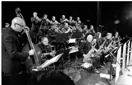
Die Big Band Saulgau präsentiert bei ihrem Jahreskonzert die ganze Welt der gesungenen Bigband-Musik.

Der Jazzverein Bad Saulgau lädt zu diesem besonderen Konzert herzlich ein. Der Kartenvorverkauf ist gestartet. Interessierte können sich für 14 Euro ihr Ticket bei Augenoptik Nerlich und der Tourismusbetriebsgesellschaft Bad Saulgau sichern.