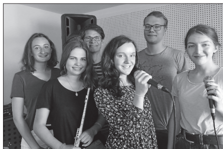
Schüler der Städtischen Musikschule spielen im Jazzkeller.