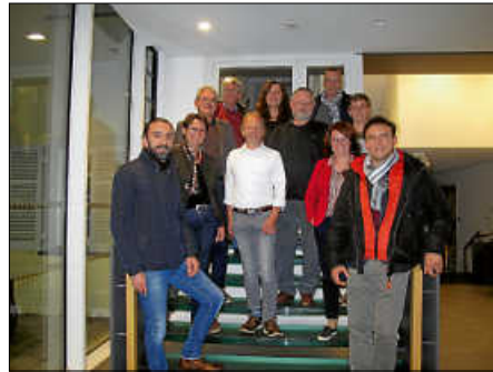
Unser Bild zeigt die Mitglieder der Steuerungsgruppe nach dem ersten Treffen.

gerne zur Verfügung. Für die Steuerungsgruppe wird zudem noch ein Vertreter der Gastronomie gesucht. Interessierte können sich jederzeit gerne bei Herrn Gentner melden.