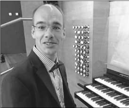
Urheber: Winfried Lichtscheidel

Als Organist konzertierte Winfried Lichtscheidel bei renommierten Festivals in mehreren Ländern Europas. Rundfunkaufnahmen in Wien, im großen Sendesaal des ORF-Radiokulturhauses sowie beim BR (Bayerischer Rundfunk) und DLF (Deutschlandfunk) ergänzen seine vielfältige Tätigkeit als Orgelvirtuose. Seit 2010 ist Winfried Lichtscheidel Organist und Kantor an St. Martinus und Ludgerus in Sendenhorst, wo er inzwischen 10 CDs an der dortigen Woehl-Orgel einspielte. Seine Einspielung mit den 10 Orgelsymphonien von Charles-Marie Widor wurde 2018 mit dem „Preis der deutschen Schallplattenkritik“ ausgezeichnet.