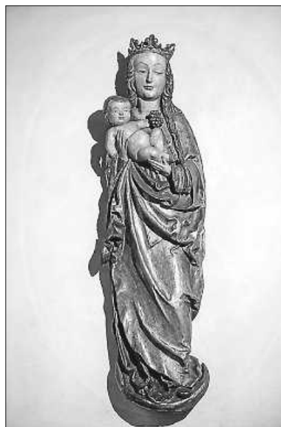
Gotische Madonna mit Kind in der Stadtpfarrkirche Bad Saulgau, um 1500

Seelsorgeeinheit Sankt Johannes Baptist Bad Saulgau