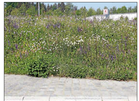
Kreisverkehr an der Hochberger Straße

sen an der Kernstadtentlastungsstraße sind bundesweit in verschiedenen Fachzeitschriften zu sehen und schmücken sogar die Titelseiten dreier Broschüren des Verkehrsministeriums Baden-Württemberg zum Straßenbegleitgrün - die beste Werbung für die Artenvielfalt und die Landeshauptstadt der Biodiversität Bad Saulgau. In den nächsten Tagen stehen weitere Blumenwieseneinsaaten mit vielen Tausend Quadratmetern an. Allein am und im neuen Recyclinghof in der Moosheimer Straße entstehen ca. 3.500 qm, an der Schwarzach 2.000 qm. Auch im neuen Baugebiet „Krumme Äcker 4“ und in den Ortsteilen werden verschiedene Mischungen eingesät. Auch die bestehenden Blumenwiesen an der Buchauer Straße, hinter dem Störck-Gymnasium, an den Regenrückhaltebecken in Bondorf und Bogenweiler und beim Wanderparkplatz des NaturThemenParks sind ein wahrer Blickfang.