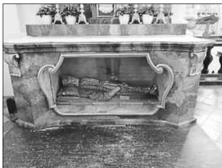
linker Seitenaltar in der Pfarr- und Klosterkirche St. Markus, Reliquie der Hl. Columba

Wegen der derzeit erhöhten Ansteckungsgefahr in Bezug auf Corona möchten wir wieder dazu übergehen die Mundkommunion außerhalb der Messfeier zu spenden. Nach jeder Mess- oder Wortgottesfeier dürfen Sie sich hierzu gerne in der Sakristei melden und können dann im Anschluss an den jeweiligen Gottesdienst die Mundkommunion empfangen. Herzlichen Dank für Ihr Verständnis!