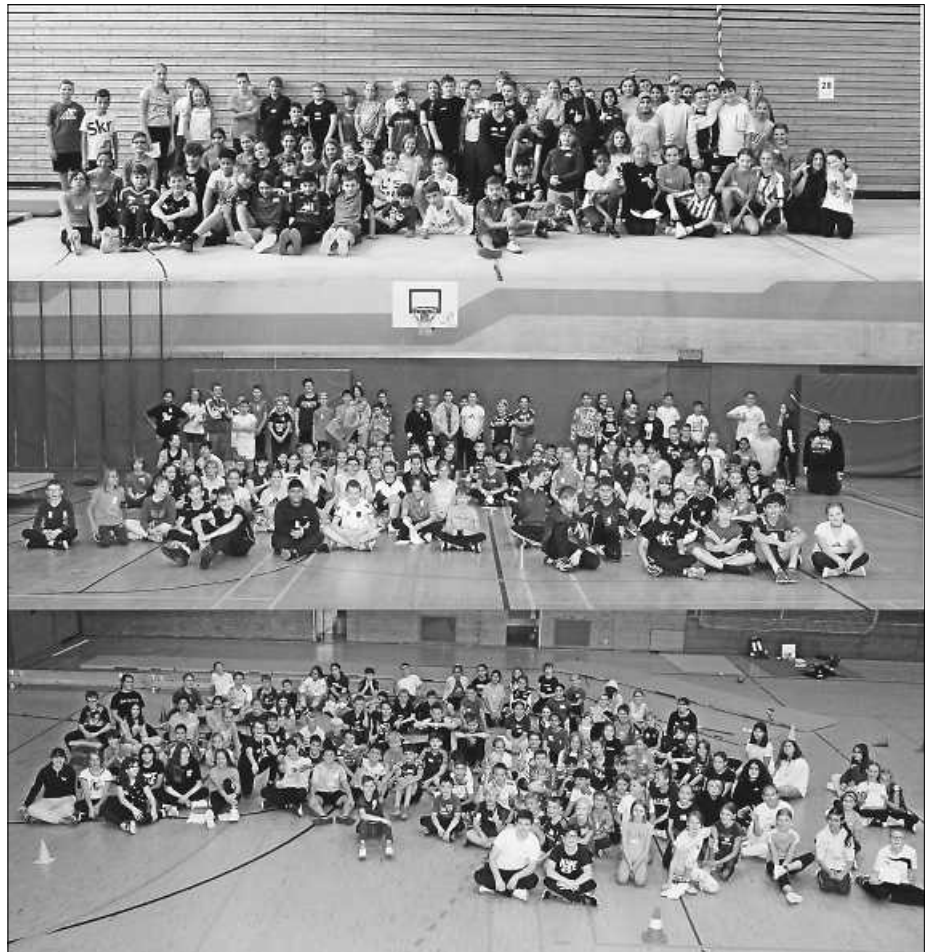
Die 48 Schülerteams des „Gemeinsamen Sporttags“ 2022

In diesem Jahr unterstützten erneut zahlreiche Schülerinnen und Schüler