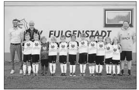
Kleider machen Leute und Trikots machen Spieler ...

Mit großer Freude und sichtlich stolz präsentieren die F-Jugend-Kicker und -Kickerinnen des FV Fulgenstadt ihre neuen Trikots.