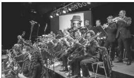
Big Band Bad Saulgau jazzt zum wiederholten Mal im Stadtforum Bad Saulgau

Der Jazzverein Bad Saulgau lädt zu diesem besonderen Konzert herzlich ein.