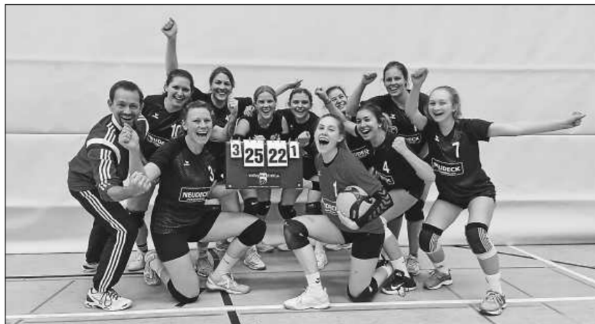
Große Freude beim Siegeteam