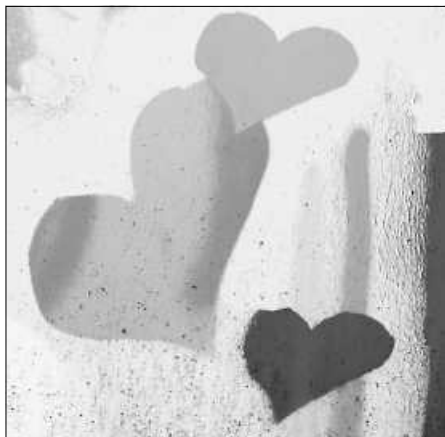
Graffiti in: Pfarrbriefservice.de

Seelsorgeeinheit Sankt Johannes Baptist Bad Saulgau