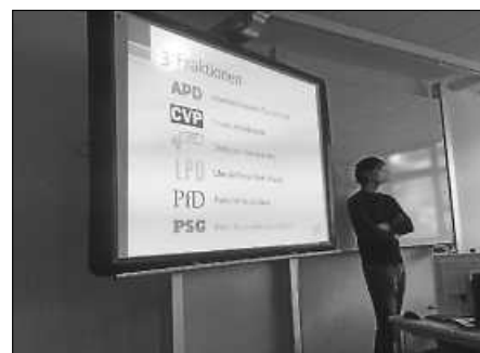
Fiktive Parteien im Planspiel

„Die Corona-Krise hat Deutschland fest im Griff. Die Wirtschaft steckt in einer tiefen Rezession. Menschen verarmen. In diesem – halb fiktiven, halb realen – Szenario des Planspiels „Katastrophenfall“ spitzt sich die Lage täglich dramatischer zu. Ungleiche Regeln in unterschiedlichen Bundesländern erschweren die Eindämmung. In dieser Situation möchte die Bundesregierung reagieren können: schnell, effizient und zielgerichtet. Aus diesem Grund möchte die Regierung, dass der Bundestag ihr größere Entscheidungsbefugnisse einräumt. Sie bringt das ‚Kompetenzerweiterungsgesetz zur Bekämpfung der Coronapandemie‘ ein. Im ordentlichen Gesetzgebungsverfahren entscheiden die fiktiven Bundestagsfraktionen über die Annahme des Gesetzes. Die Schülerinnen schlüpfen dabei in die Rolle von Bundestagsabgeordneten und debattieren über den Vorschlag.“