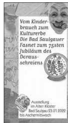
Flyer zur Ausstellung