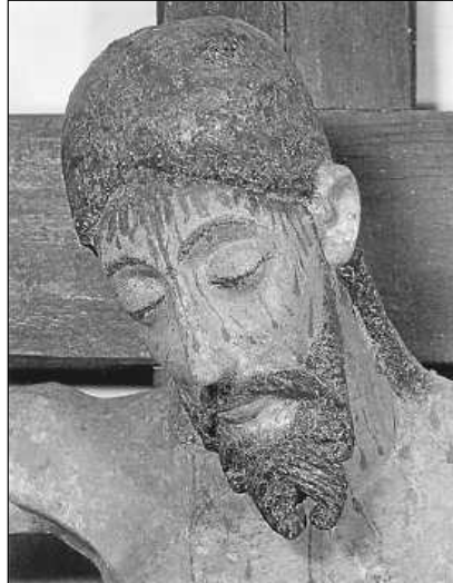
Gekreuzigter, Romanisches Großkreuz in der Kreuzkapelle Bad Saulgau

Seelsorgeeinheit Sankt Johannes Baptist Bad Saulgau