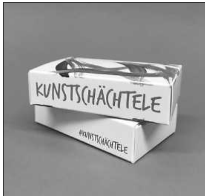
Aus jedem Schächtelchen kommt ein kleines, liebevoll gestaltetes Kunstwerk.

Unter dem Hashtag #kunstschächtele wird nach und nach die bunte Vielfalt der Kunstwerke aus dem KUNSTschächtele sichtbar werden, wenn viele ihren freudigen Überraschungsmoment nach dem Öffnen des Schächtelchens in den sozialen Medien teilen.