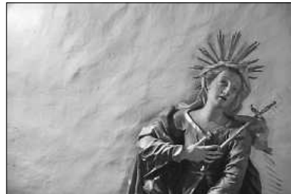
in: Pfarrbriefservice.de Foto: Christine Limmer

sind an diesem Sonntag für die Fastenaktion Misereor bestimmt.