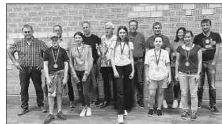
Die Gewinner der verschiedenen Wertungen mit Vereinsvertretern und Organisatoren