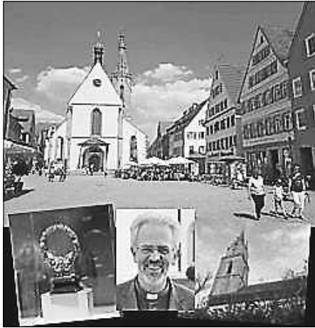
Kirchengemeinde Sießen

Anmeldung bis 11.6.2023 bei Siegfried Rau (Tel. 07581 2007675 oder 0176 34479571); hier gerne weitere Auskunft, ebenso in ausgelegten Flyern und Aushängen in der Barockkirche Sießen.