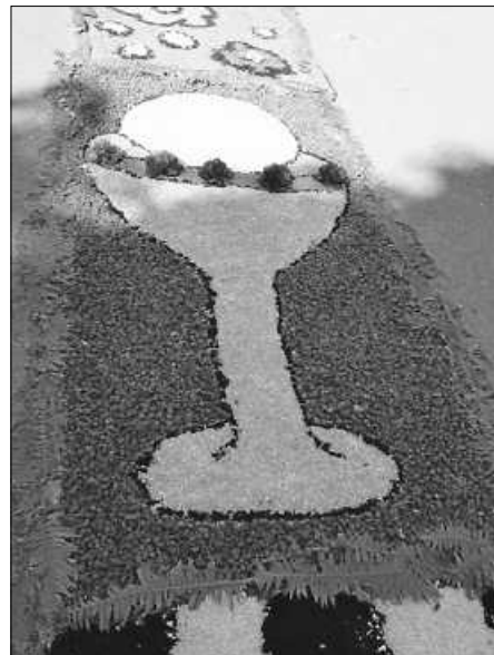
Fronleichnamtepich-KLJB