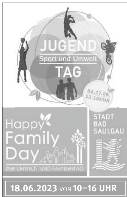
Flyer: Stadt Bad Saugau

musikalischen Weisen zum Besten. Beim „Dreikönig“ in der Fußgängerzone stellt sich der Jazzverein vor und gibt kleine musikalische Kostproben ab.