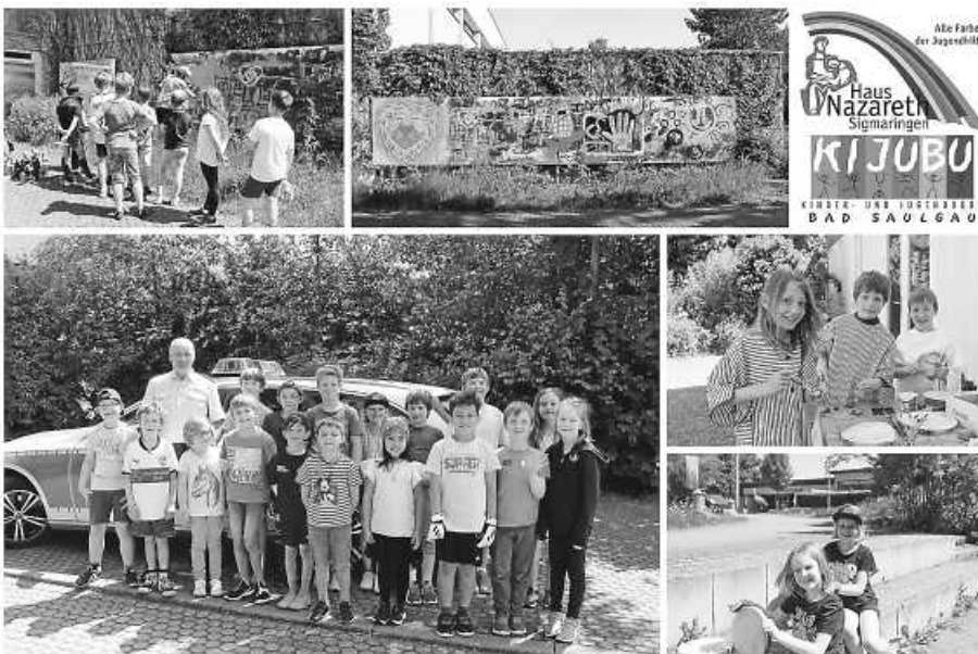
Die Kinder der Ferienzeitbetreuung erfahren neben Spiel und Spaß auch Wissenswertes über Berufe.

Die Teilnahme ist kostenlos, eine Anmeldung ist nicht erforderlich. Die Stadtbib-