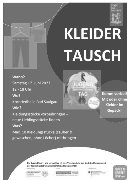
Plakat: Stadt Bad Saugau

Neben dem Kleidertausch gibt es ein Beachvolleyball-Turnier, Graffiti-Wände, Glücksrad, eine offene Bühne, Musik und gutes Essen.