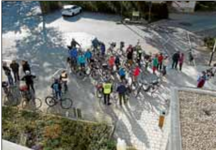
Start der Abschlusstour