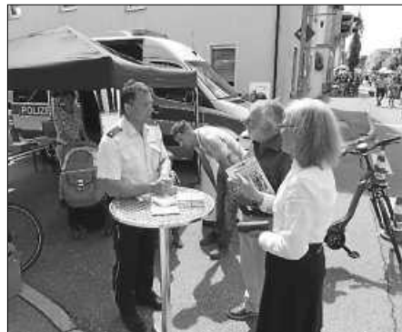
Ebenso sehr informativ war auch die Sicherheitsberatung der Polizei.