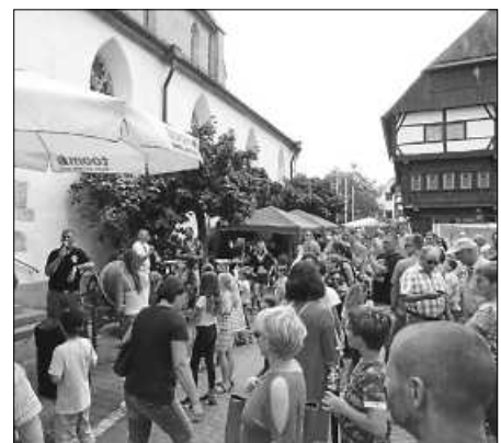
Viel Gedränge und Spaß gab's auch bei den Ständen des TOOM-Baumarkts und der Dorauszunft.