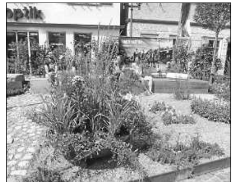
...oder einfach „chillen“ im Naturgarten beim Luegebrunnen.