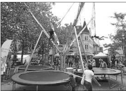
Das beliebte Dreier-Bungee-Jumping der Stadtwerke durfte genauso wenig fehlen wie...