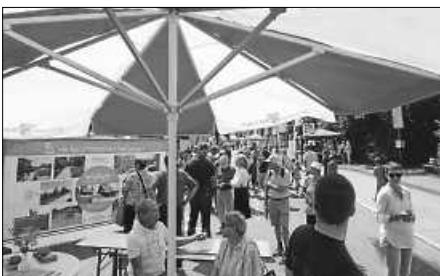
Einer riesigen Nachfrage erfreute sich der NaturThemenPark beim Stand der Tourismusbetriebsgesellschaft und den Guides.