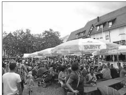
Die Vereine auf dem Marktplatz hatten alle Hände voll zu tun, um die vielen Besucher satt zu bekommen.

Aussteller ließen sich die Laune dadurch nicht verderben. Die Stimmung war durchweg gut, die Besucher waren überaus interessiert am Bildungs- und Spielangebot. Egal ob in der Garten- und Landschaftsstraße, der Landwirtschaftsstraße, der Energiestraße, der Gesundheits- oder der Erlebnisstraße, überall gab's was zu lernen, spielen, lesen, basteln oder zu arbeiten. Kinder und Jugendliche konnten Umweltaufgaben lösen, sich aktiv einbringen oder Fragen beantworten, die Erwachsenen konnten sich so lange von Betrieben, Vereinen oder anderen Organisationen in Umwelt- und Gesundheitsfragen beraten lassen. Auch dieses Jahr zeigte sich erneut, dass Oberschwabens größter Umwelt- und Familientag in seiner Konzeption einzigartig ist und deshalb bei Jung und Alt, Groß und Klein so beliebt ist. Auch zu essen und zu trinken gab's auf dem gut einen Kilometer langen Rundkurs genügend Einfallsreiches und Vielfältiges. Die Besucher konnten neben Fisch und Steak auch viele vegetarische Gerichte wählen. Auf dem Marktplatz und in der Oberen Hauptstraße gab's zudem musikalische Unterhaltung. Die Tourismusbetriebsgesellschaft und das städtische Umweltamt konnten mit dem Verlauf und dem Besuch der Großveranstaltung äußerst zufrieden sein. Auch die Aussteller freuten sich über den großen Zuspruch.