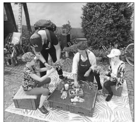
...und beim Bio-Sträuße basteln.