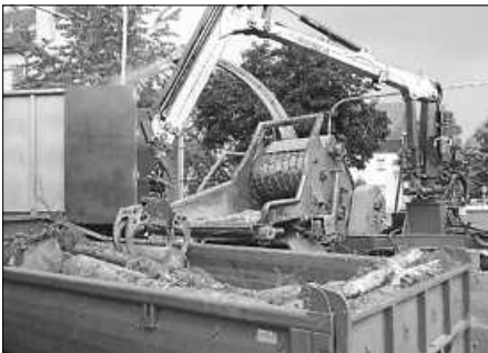
sehr beeindruckend dort auch der Riesenholzhäcksler der Firma Eisele.