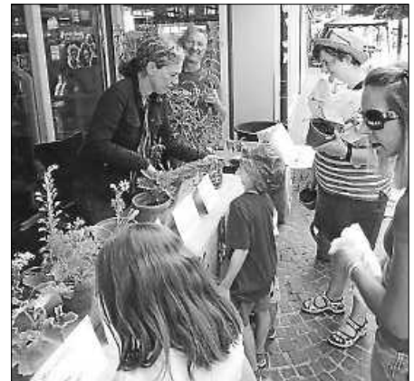
Kaum zu bremsen waren die Kinder beim Eintopfen von heimischen Blumen ...