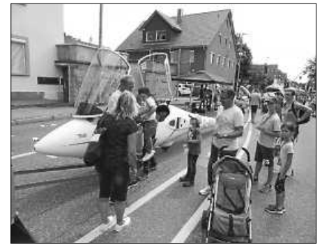
In der Kabine des Segelflugezeugs konnte man sich gut verstecken.