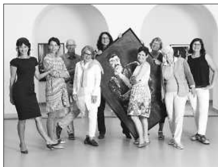
Das Foto zeigt den alten und neuen Vorstand des Kunstvereins.