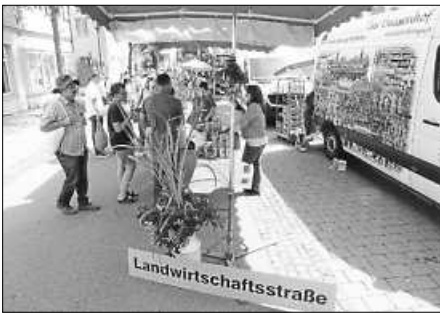
Viel Bio gab's zudem in der Landwirtschaftsstraße...