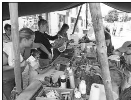
Die Royal Rangers malten mit den Kindern ohne Unterlass.