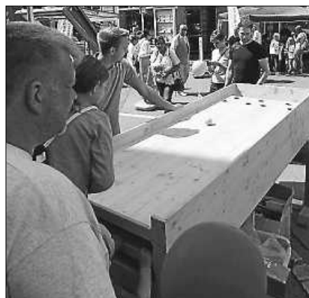
Eine tolle Sache, das Holzkugel-Kegeln der Firma Ummenhofer.