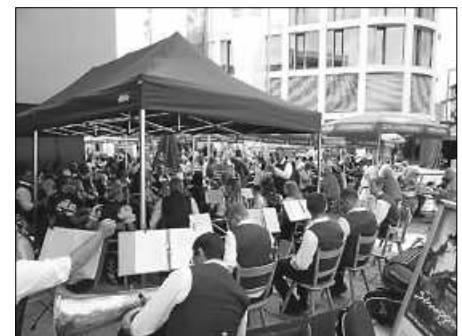
Viel Musik gab's und ließ um 16.00 Uhr den rundum gelungenen 19. Happy Family Day harmonisch ausklingen.