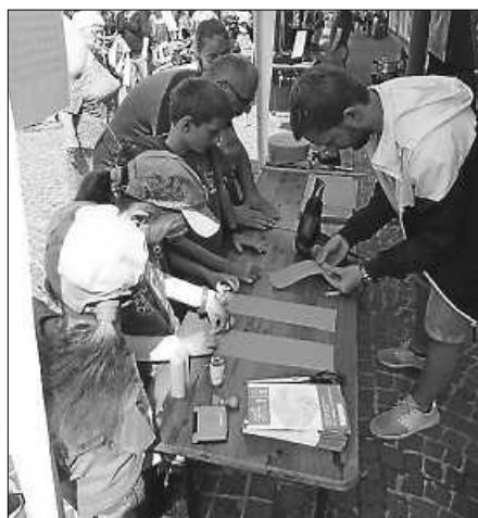
Mit Bienenwachs basteln konnte man in der Garten- und Landschaftsstraße ...