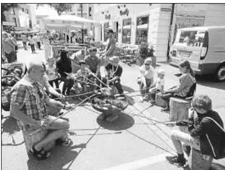
...das Stockbrotbacken der Firma OfenWidmer.