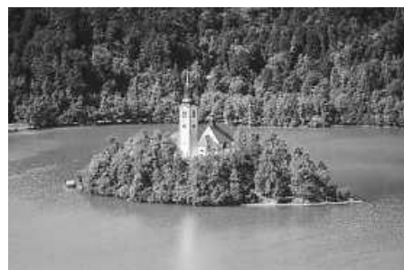
Bleder See, auch Veldeser See, Oberkrain, Slowenien

Seelsorgeeinheit Sankt Johannes Baptist Bad Saulgau