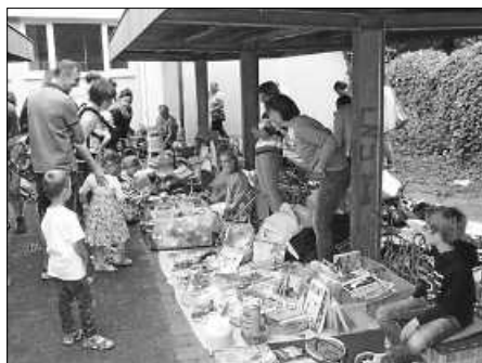
Kinderflohmarkt Juli 2018