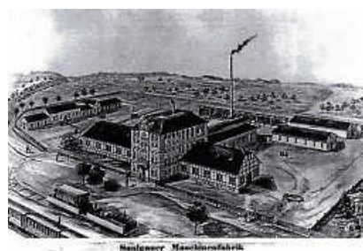
oben links: Maschinenfabrik Bautz mit Fabrikgeleise (wird heute noch von der Fa. Claas genutzt) oben rechts: Carl Platz mit Fabrikgeleise unten rechts: Holzlieferung für die Firma Staudt

Und kaum agierte Altshausen auf der Seite von Saulgau für die heutige Strecke der württembergischen Allgäubahn, machte ihm die Buchauer Gruppe den Bahnanschluss streitig. Im Entscheidungsjahr 1865, in dem die grundlegenden Staatsverträge mit Baden und Preußen verabschiedet wurden und schließlich die Linie vom Allgäu bis Balingen ihren