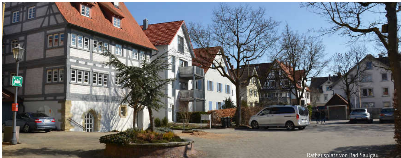
Rathausplatz von Bad Saulgau

IM MODELLPROJEKT „ORTSMITTEN- GEMEINSAM BARRIEREFREI UND LEBENSWERT GESTALTEN“