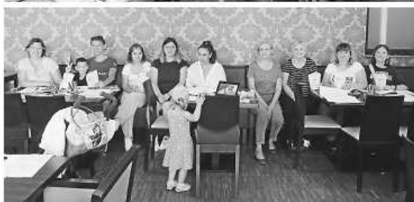
Die ukrainischen Sprachkurs Teilnehmer/-innen freuten sich über den kleinen Lernmotivationsbeitrag vom Kinder- und Jugendbüro/Haus Nazareth.