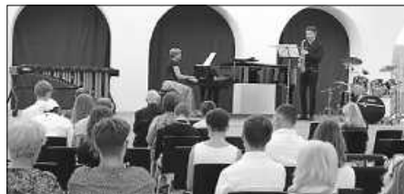
Das Foto zeigt den Gewinner des Kurt-Staud-Preises.