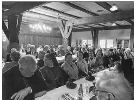
Voll besetzt war die Versammlung des Trachtenvereins

Anträge sind bis zum 1. April 2023 schriftlich bei der Ortsvereinsvorsitzenden Frau Severin Eninger, Gutenbergstr. 13/1, 88348 Bad Saulgau, einzureichen.