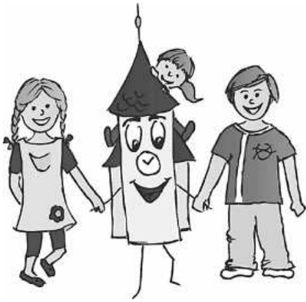
in: Pfarrbriefservice.de Foto: Sarah Frank / Factum.adp