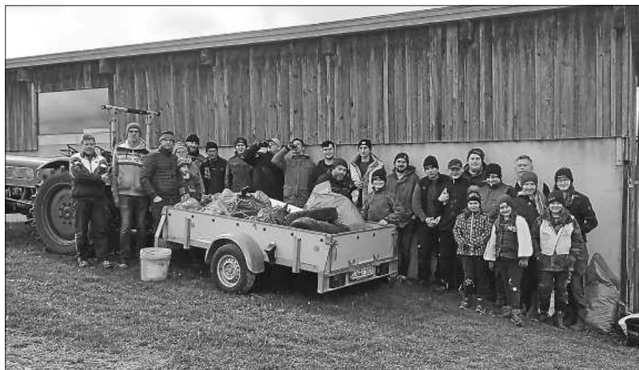
Die fleißigen Helfer

Die Vorstandschaft des Freizeit-, Heimat- und Brauchtumsvereins Moosheim bedankt sich bei den fleißigen Helfern der Feld-, Wiesen- und Waldputzete 2023. Auch ein herzliches Dankeschön an den Bauernverband BC-SIG und an die Ortsverwaltung Moosheim für den finanziellen Zuschuss für das Helferverseper.