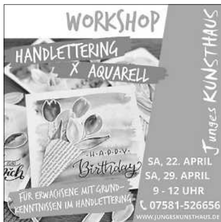
Beide Flyer: Junges KUNSTHAUS