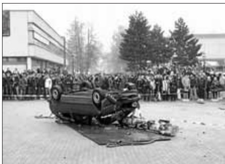
Verunfalltes Fahrzeug mit eingedrückter Frontpartie, wieder auf dem Kopf liegend, und Baumstamm