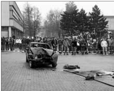
Verunfalltes Fahrzeug mit total eingedrückter Frontpartie, wieder auf allen vier Rädern stehend

Die Veranstalter sind mit dem Ablauf und dem Ergebnis der Verkehrssicherheitswoche sehr zufrieden. Man merkte, dass die Schüler mit Interesse an den verschiedenen Programmpunkten teilnahmen. Alle äußerten sie Hoffnung, dass die Eindrücke noch lange nachhaltig in den Köpfen vorhanden bleiben.