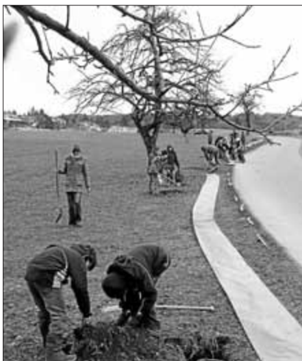
Dieses Bild zeigt den Zaunaufbau in Hochberg.

Im Hochberger Ried am Gemeindeverbindungswege Lampertweiler-Hochberg waren am Freitag, 13.3.2009, die Pfadfinder Royal Rangers mit dem BUND, Hermann Engler und dem städtischen Umweltbeauftragten aktiv. Sie halfen, einen 350 Meter langen Zaun aufzubauen und haben sich auch für die Leerung der Eimer an einigen Tagen der Woche bereit erklärt. Wer noch bei der Eimerleerung helfen möchte, kann sich beim BUND, Tel. 8407, melden.