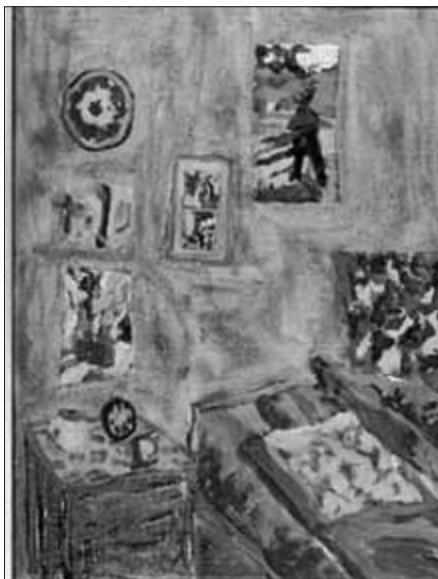
Hommage à Purrmann