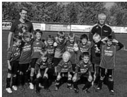
F-Jugend-Meistermannschaft 2009

Ebenso Erster in ihrer Staffel wurde die F-Jugend mit dem Trainergespann Christoph Fuchs und Manfred Waller - super gemacht!