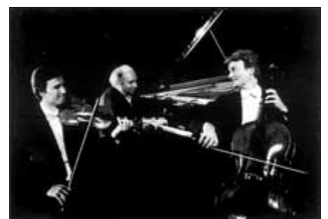
"Guarneri Trio Prag"

Am Mittwoch, 20.5.2009 , gastiert um 20.00 Uhr im Foyer der Stadthalle Bad Saulgau im Rahmen der Musikfestwochen Donau-Oberschwaben das renommierte "Guarneri Trio Prag". Das Ensemble, das seit 1995 schon mehrfach mit großem Erfolg in Bad Saulgau konzertierte, vereinigt drei international anerkannte Solisten, die eine reiche Erfahrung aus der tschechischen Kammermusiktradition mitbringen. Es zählt zu den Spitzenensembles der Kammermusikszene und spielte weltweit auf den wichtigen Festivals. Laut der Sunday London Times, gibt es "heute kein virtuoseres und musikalischeres Klaviertrio auf der Welt".