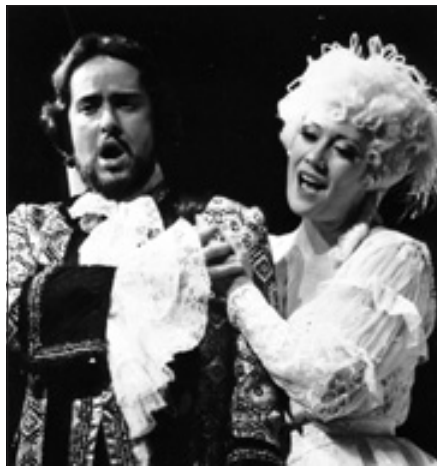
"Der Bettelstudent"

Wie jedes Jahr bietet das städtische Kulturamt um die Weihnachtszeit kulturelle Highlights an, die anspruchsvoll und gleichzeitig höchst unterhaltsam sind.