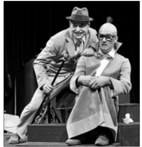
"Der Wunschpunsch"

Karten für die Aufführungen gibt es ab sofort bei der Tourist-Information, Tel. 07581 2009-15.