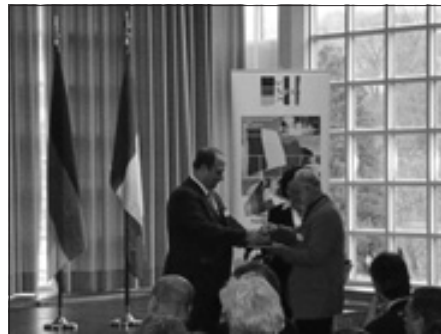
Gewerbliche Schule Bad Saulgau