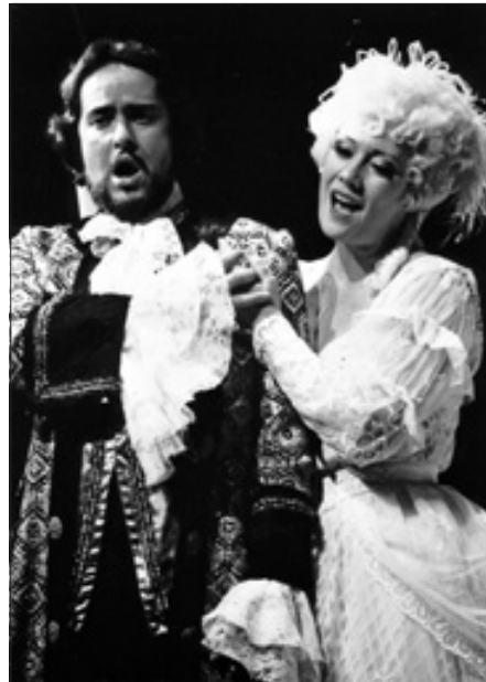
Der Bettelstudent

Welterfolg. Die geglückte Mischung aus amüsanter, fesselnder Handlung mit einer beschwingten Musik hat bis heute nichts von ihrem Charme verloren. Das Operettentheater Salzburg - vergangenes Jahr mit einer umjubelten Csárdásfürstin in Bad Saulgau - steht ganz in der Tradition der klassischen Operette und bringt den "Bettelstudenten" leicht entstaubt mit großer Besetzung, Orchester und frischem Esprit auf die Bühne. Das hervorragende Solistenensemble wird dabei unterstützt von einer Ballett-Compagnie und garantiert ein unterhaltsames Feuerwerk aus viel Spielwitz, Eleganz und Stimmgewalt.