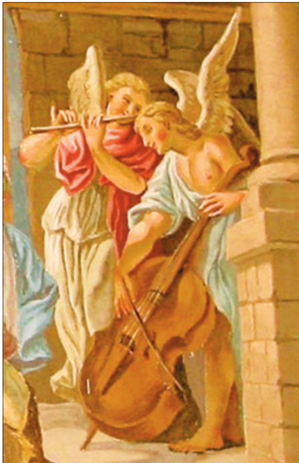
Musizierende Engel, Pfarrkirche Friedberg, 1924