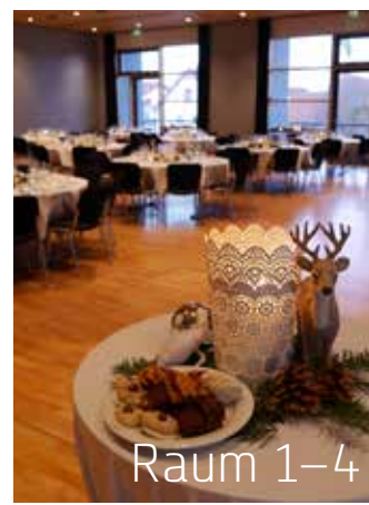
Raum 1-4 Familienfeste für bis zu 90 Personen finden in den kleinen Sälen den passenden Rahmen